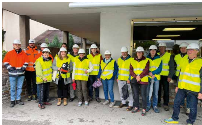
Die ÖBB-Projektleiter (in Orange) führten durch die Baustelle am Bahnhof Fritzens-Wattens

Von 16. bis 22. September stand Wattens im Zeichen der Europäischen Mobilitätswoche. An zwei Terminen führten die Projektverantwortlichen der ÖBB durch die Baustelle am Bahnhof Fritzens-Wattens. Die Volksschulen beteiligten sich mit den „blühenden Straßen“, im Höralt brachte die Firma SWARCO drei große Schul-Piktogramme auf den Asphalt auf. Der beliebte Pumptrack beim Pavillon blieb auf Wunsch vieler Familien länger aufgestellt. Den Höhepunkt bildete die Radparade durch Wattens mit fast 100 Teilnehmern.