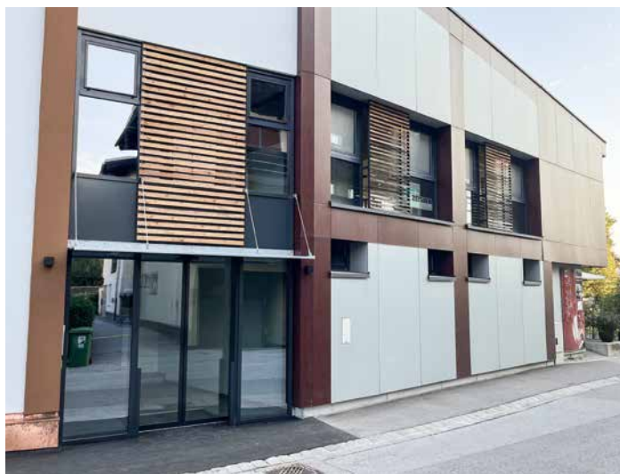
Ein moderner Lift und das neue helle Stiegenhaus erschließen die Geschäftsflächen im Heltschlhaus barrierefrei