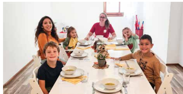
Der neue Mittagstisch im Kindergarten Oberdorf