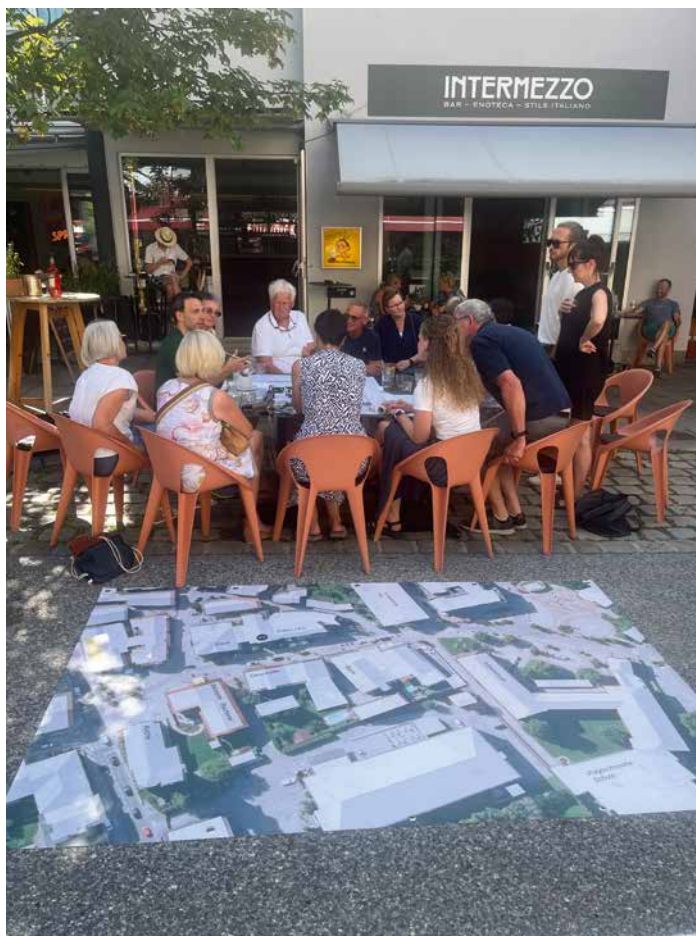
Viele nutzten die zwei offenen Büros am Kirchplatz um sich mit Ideen einzubringen

Derzeit wird das Material von den Prozessbegleitern bearbeitet. Danach bekommen Gemeinderat und Öffentlichkeit einen Zwischenbericht. Die Entscheidung über die Zukunft des Kirchplatzes wird Ende des Jahres getroffen werden.