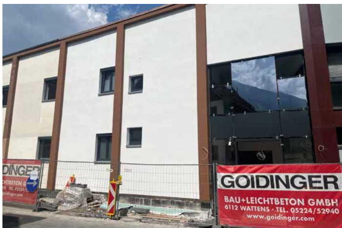
Das neue Stiegenhaus samt Lift wertet die Mietobjekte im Heltschlhaus auf

Das neue Stiegenhaus samt Lifteinbau zur barrierefreien Erschließung macht die Geschäftsflächen im historischen Heltschlhaus (Felix-Bunzl-Str. 6) noch attraktiver. Im September werden die letzten Arbeiten abgeschlossen. Mit barrierefreien 216m 2 im 1. OG bietet die Gewerbeimmobilie ausreichend Platz für vielfältige, geschäftliche Aktivitäten. Bei Bedarf kann die Einheit um 60m 2 erweitert werden.