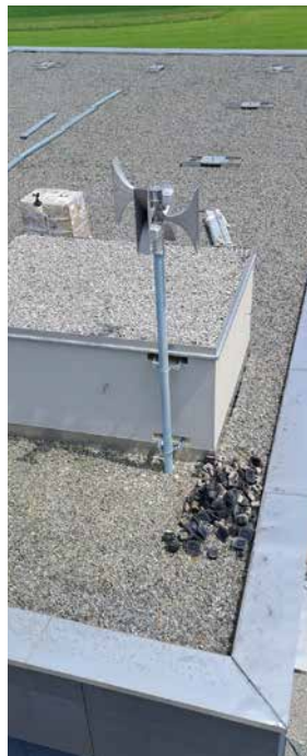
Die neue Sirene wurde am Dach des QAB installiert

Beim ersten offiziellen Samstagstest am 27. Juli 2024 überzeugte das neue Gerät mit voller Lautstärke. Eine Alarmeinrichtung dieser Art dient in erster Linie zur Katastrophen- und Zivilschutzwarnung der Bevölkerung.