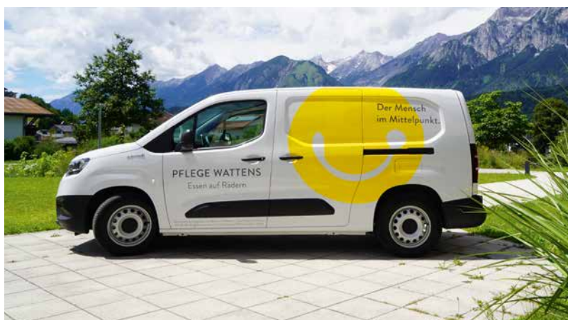
Der neue Toyota Proace für Essen auf Rädern

fizveranstaltung anlässlich des 40. Geburtstages von Bürgermeister Lukas Schmied statt. Die Großspender*innen sind am Fahrzeug verewigt. Herzlichen Dank an sie alle und an die vielen ehrenamtlichen Fahrer*innen!