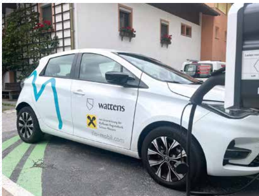
Ihr Elektroauto zum günstigen Ausleihen: floMOBIL mit zwei Fahrzeugen in Wattens

Sie möchten umweltfreundlich, kostengünstig und flexibel unterwegs sein? Die Marktgemeinde Wattens unterstützt Sie dabei: mit eCarsharing, RegioFlink und einem tirolweit gültigen VVT-Ticket, welches Sie kostenlos ausleihen können.