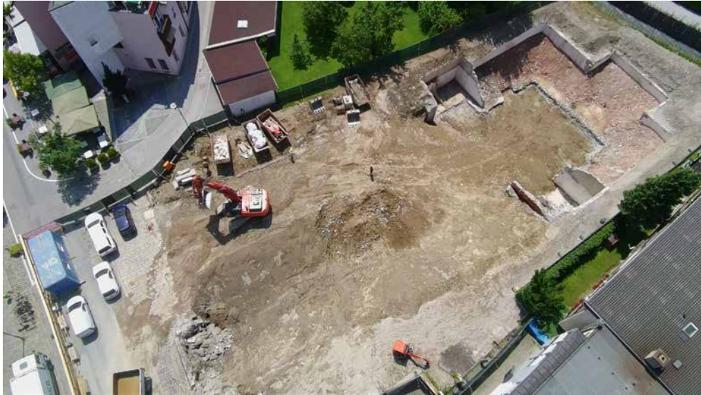
Das Baufeld aus der Vogelperspektive nach Ende der Abbrucharbeiten (aufgenommen am 11.7.)