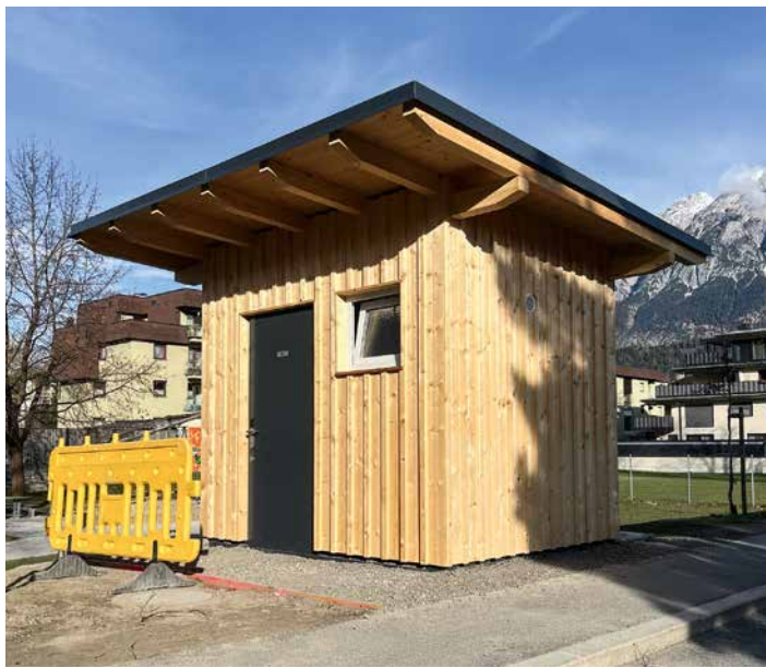
Das WC am Spielplatz Robert-Frey-Straße ist in Betrieb

Seit Ende März ist das WC am großen Spielplatz in der Robert-Frey-Straße geöffnet. Ein Zeitschloss regelt den Zutritt (Sommer: 8 bis 20 Uhr). Gereinigt wird zum Start montags, mittwochs und freitags. Bitte nutzen Sie die Toilette achtsam und melden Sie Probleme per Bürgermeldung ( www.buergermeldungen.com/wattens oder mit der App). Danke!