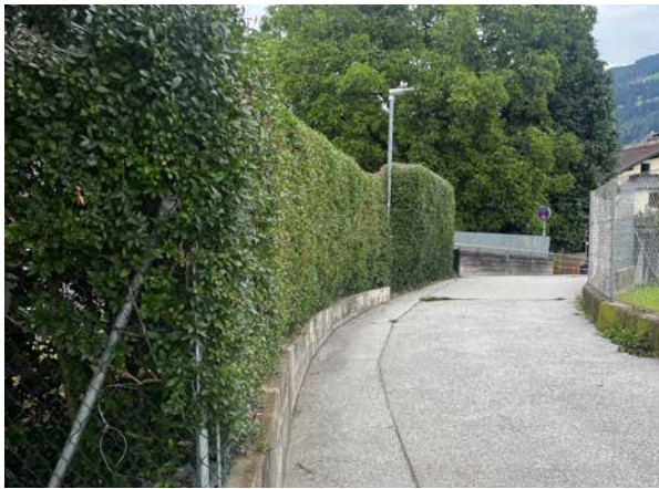
Ordnungsgemäß geschnittene Hecken sorgen für freie Sicht und sichere Alltagswege

Im Sinne der Sicherheit und des § 91 Straßenverkehrsordnung bitten wir Sie, an der Straßenseite gelegene Bepflanzungen regelmäßig zurückzuschneiden. Erfolgt dies nicht, schreibt die Gemeinde die Grundstücksbesitzer*innen gezielt an. Bleibt auch das ohne Reaktion, folgt als letzter Ausweg die Weiterleitung an die Bezirkshauptmannschaft.