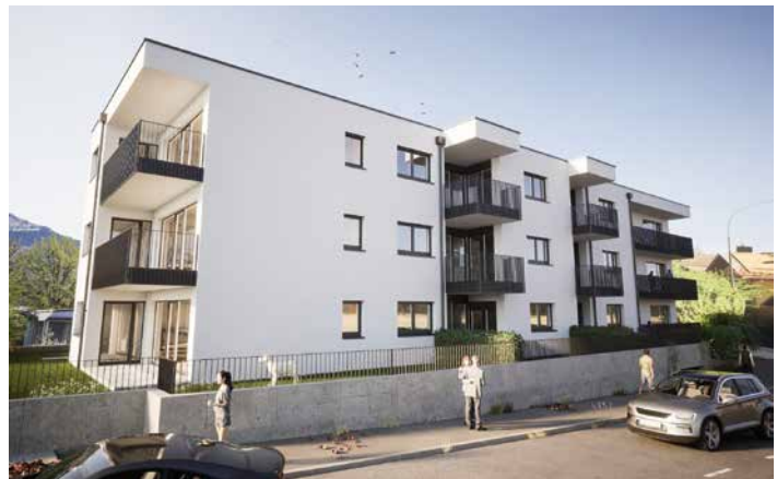
Von 12 Eigentumswohnungen in der Innsbrucker Straße vergibt die Marktgemeinde Wattens drei zu einem vergünstigten Preis