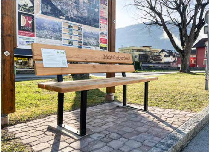
Das Mitfahrbankerl nach Baumkirchen beim Parkplatz Hammerschmidt

Das Mitfahrbankerl beim Parkplatz Hammerschmidt (Kreisverkehr Autobahnabfahrt) verbindet seit wenigen Wochen Wattens mit Baumkirchen. Wer nach Baumkirchen möchte, nimmt dort Platz. Leute, die mit dem Auto nach Baumkirchen fahren, nehmen die Wartenden mit.