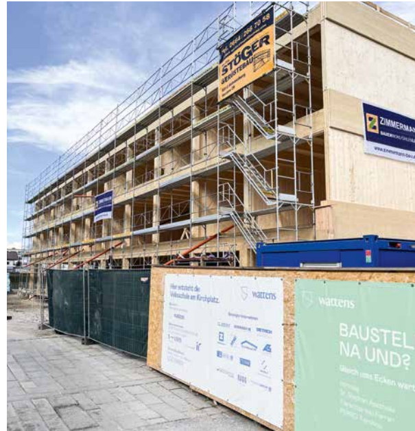
Seit 20. März dicht: der Holzrohbau der Volksschule am Kirchplatz