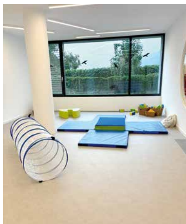
Die neue Kinderkrippe „Quartier Kunterbunt“ bietet Platz für zwei Gruppen

Machen Sie sich selbst ein Bild und besuchen Sie die Kinderkrippe am Tag der offenen Tür am Freitag, 21. März von 14:30 bis 18:00 Uhr. Erfahren Sie mehr über das pädagogische Konzept, kommen Sie mit unserem engagierten Team ins Gespräch und lernen Sie die Räumlichkeiten kennen. Wir freuen uns auf Ihren Besuch und interessante Gespräche!