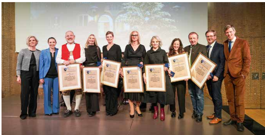
Die geehrten Mitarbeiterinnen und Mitarbeiter mit Gemeindeführung und Personalvertretung bei der Weihnachtsfeier 2024 (nicht im Bild: Max Schmadl)