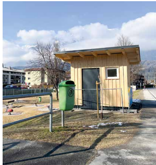
Das neue WC am großen Spielplatz bleibt ganzjährig geöffnet

Der Betrieb startet im März 2025 und bietet eine willkommene Erleichterung bei längeren Aufenthalten. „Mit diesem Serviceangebot reagieren wir auf die Bedürfnisse vieler Spielplatzbesucher und ermöglichen den unkomplizierten Zugang zu einer öffentlichen sanitären Einrichtung“, so Bürgermeister Lukas Schmied. Der Standort wurde bewusst gewählt, da hier Wasser- und Kanalanschluss kostengünstig umsetzbar waren. Das WC ist auch vom Piratenspielplatz in der Dr.-Karl-Stainer-Straße in kürzester Zeit erreichbar. Die Investitionskosten für das WC liegen wie geplant bei ca. EUR 45.000,- netto.