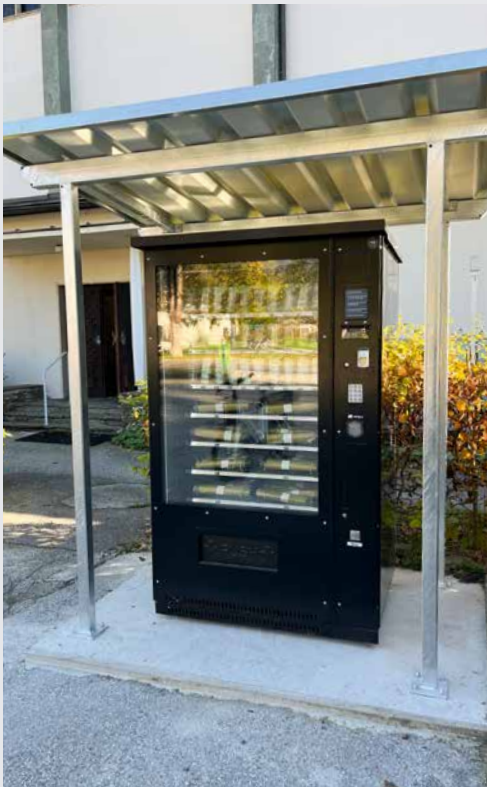
Mit Bürgerkarte liefert der Müllsackautomat für Biomüll und Gelben Sack